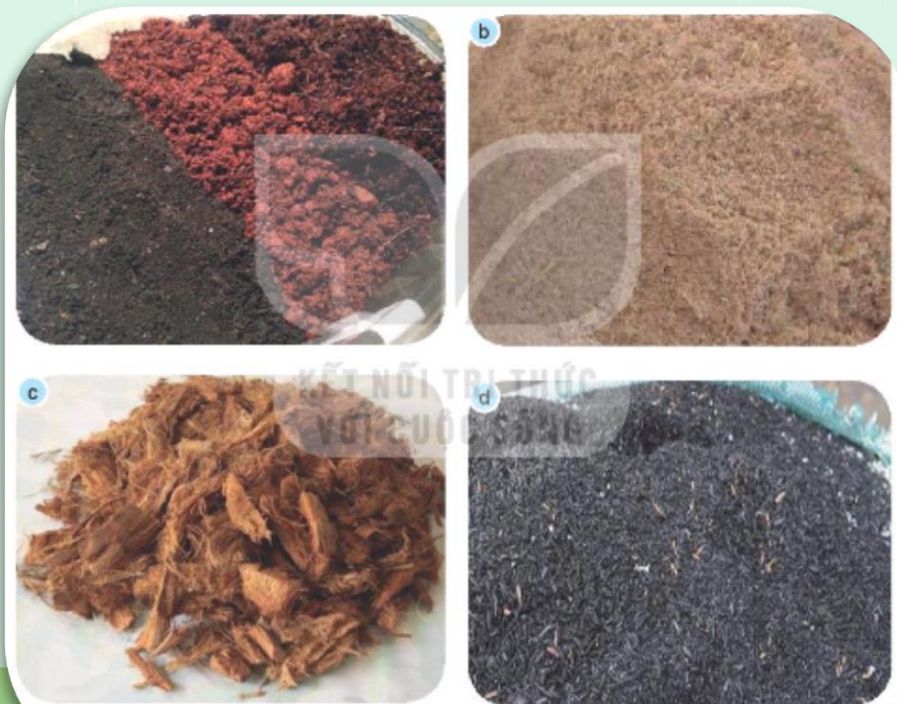
Hình 4 Một số loại giá thể trồng hoa, cây cảnh